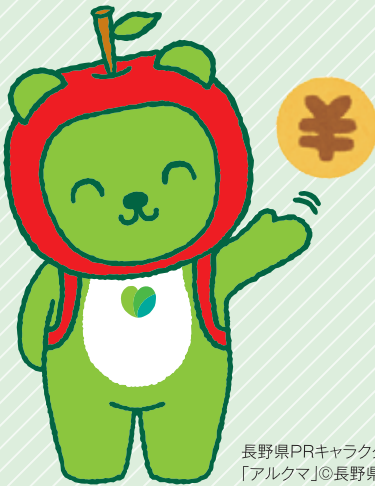
長野県PRキャラクター 「アルクマ」©長野県アルクマ